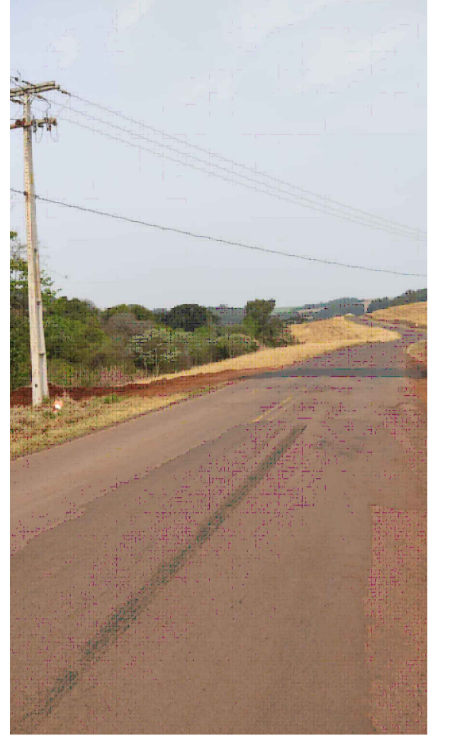
PONTO 15 - ESTRADA MUNICIPAL DOM AGOSTINHO - LOTEAMENTO VILA NOVA