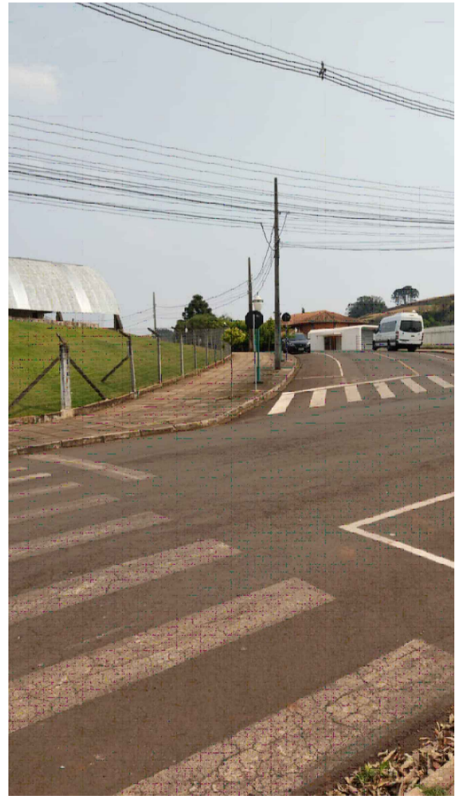
PONTO 12 - RUA IGNÁCIO DRANKA - POSTO DE SAÚDE