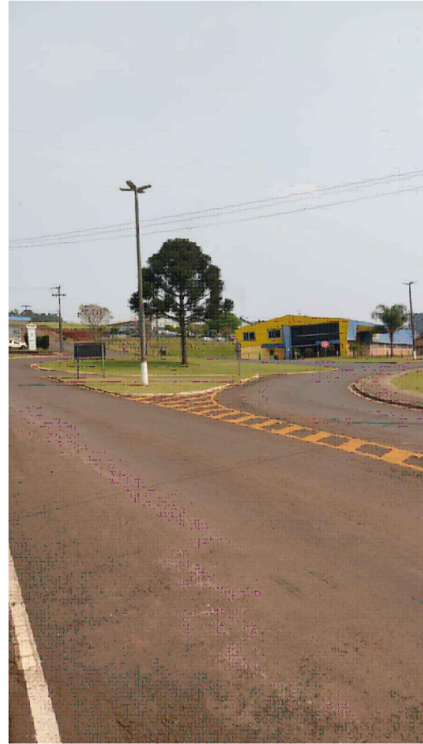
PONTO 1 - TREVO DE ACESSO A RENASCENÇA