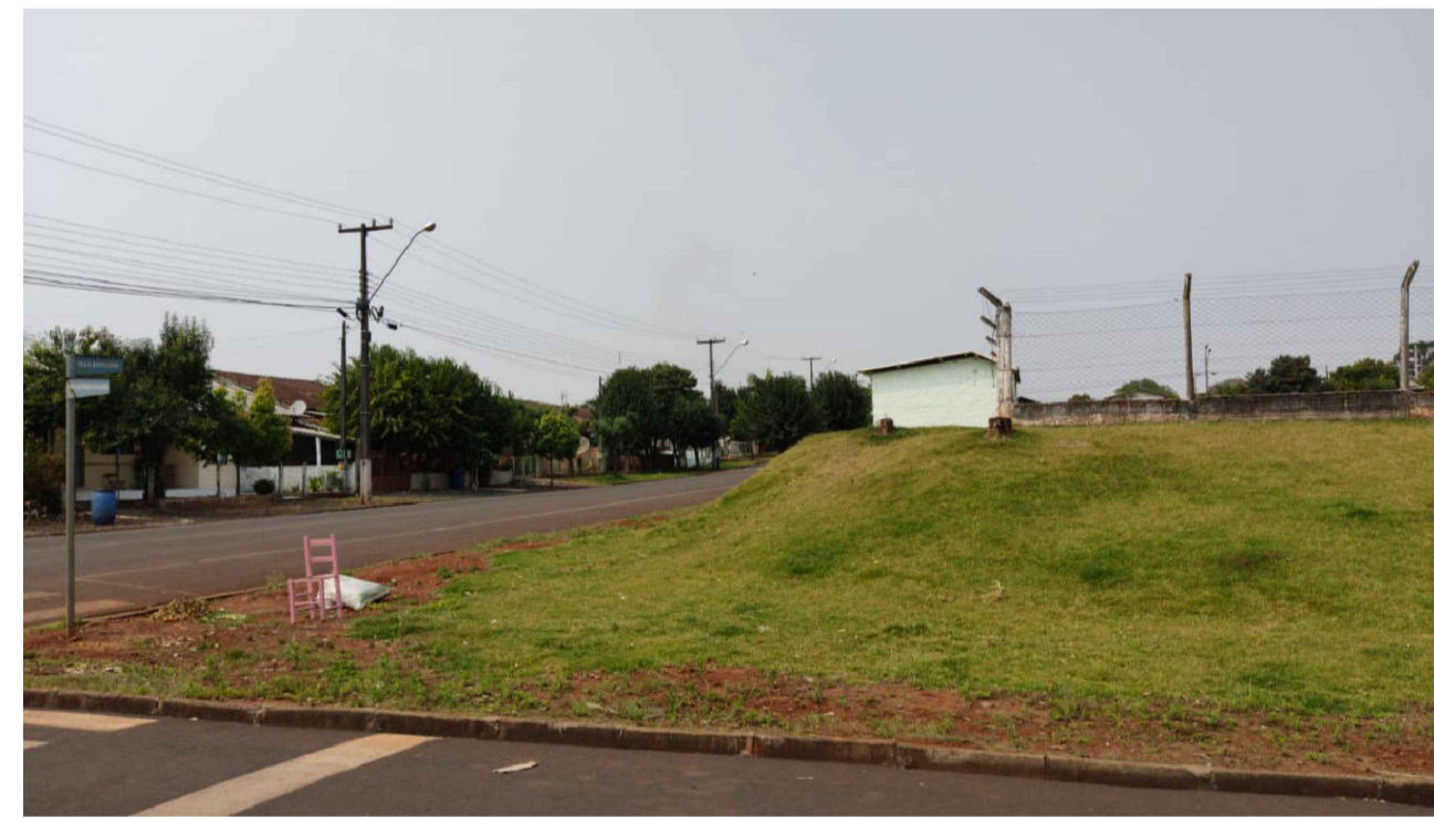
PONTO 14 - RUA ALBERTO GEME ESQUINA COM RUA LUIZ ANGELO COLÓDA