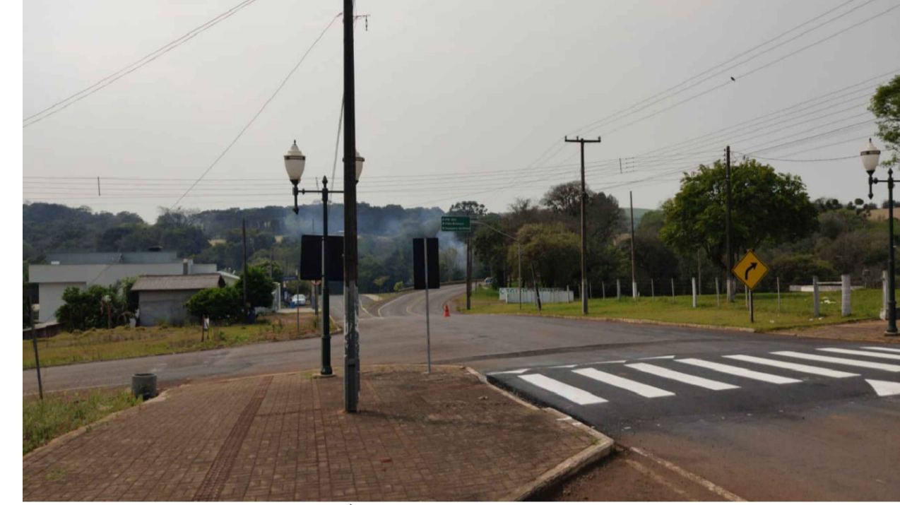
PONTO 6 - AV. PADRE IVO A. ZOLETTI - ACESSO À PATO BRANCO