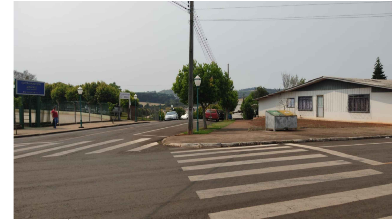
PONTO 10 - RUA CÂNDIDO MERLO ESQUINA COM RUA AGATA V. NUERNBERG