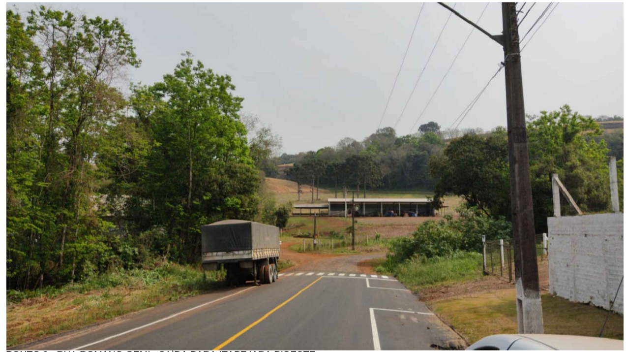
PONTO 8 - RUA ROMANO GEMI - SAÍDA PARA ITAPEJARA D'OESTE