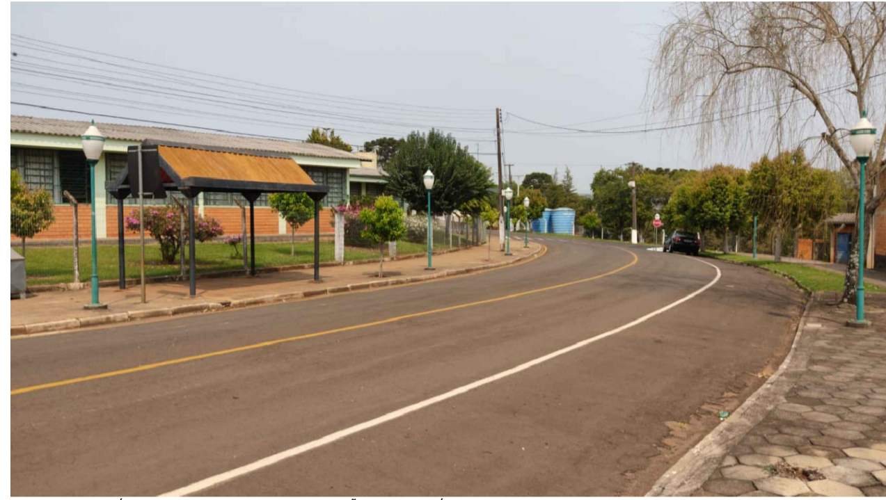
PONTO 5 - RUA AGATA NUERNBERG - ESCOLA IRMÃ NELI E COLEGIO CASTELO BRANCO