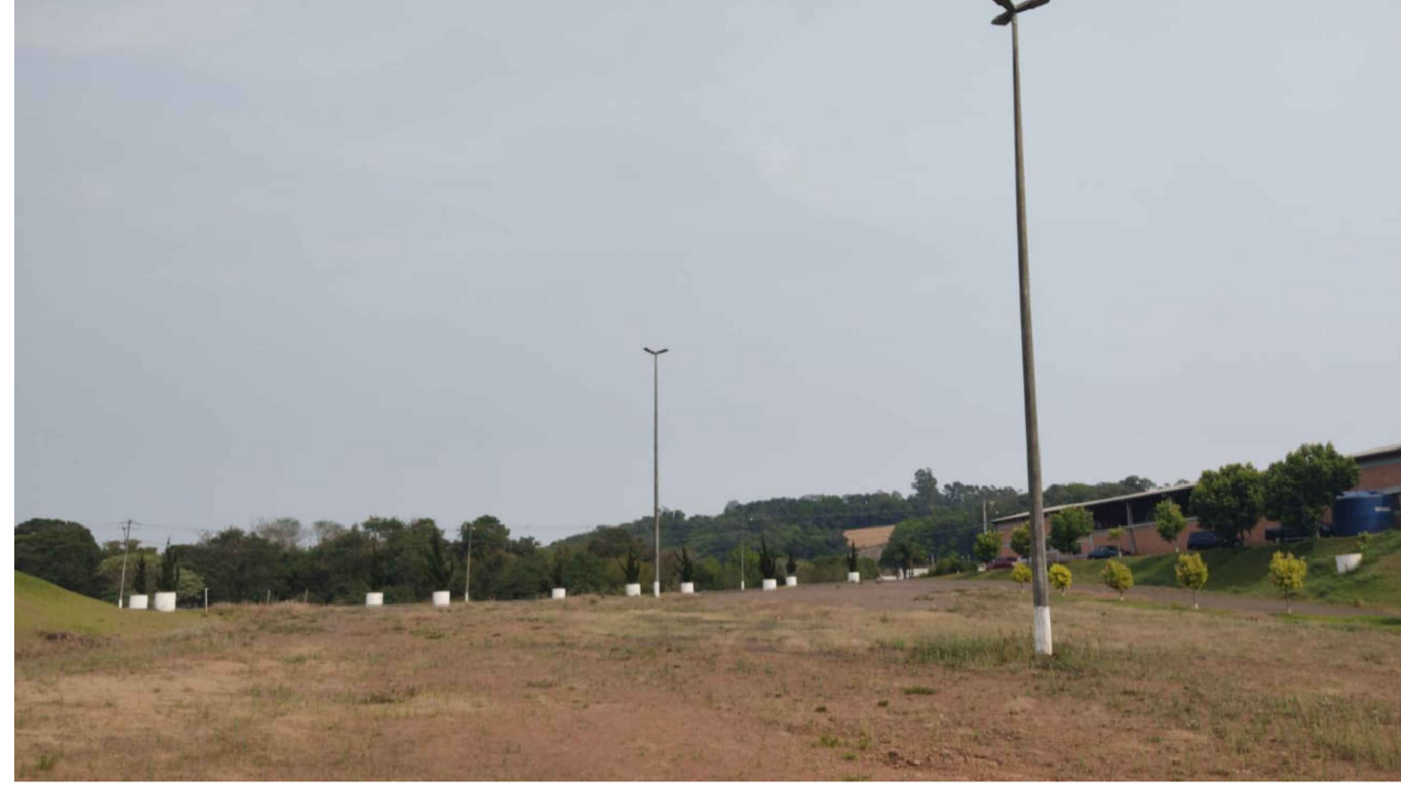
PONTO 2 - CENTRO DE EVENTOS JORDAN MUNARETTO