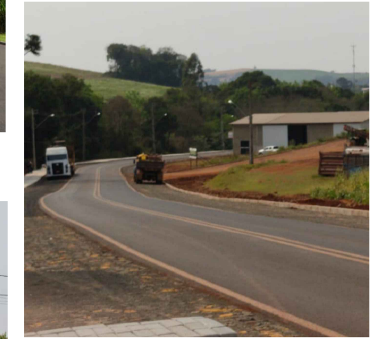
PONTO 17 - SAÍDA PARA FRANCISCO BELTRÃO