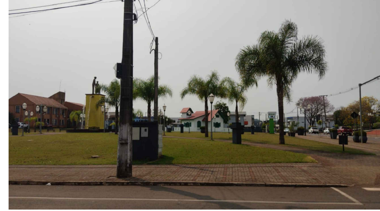
PONTO 4 - AV. PADRE IVO A. ZOLETTI - PRAÇA DA IGREJA