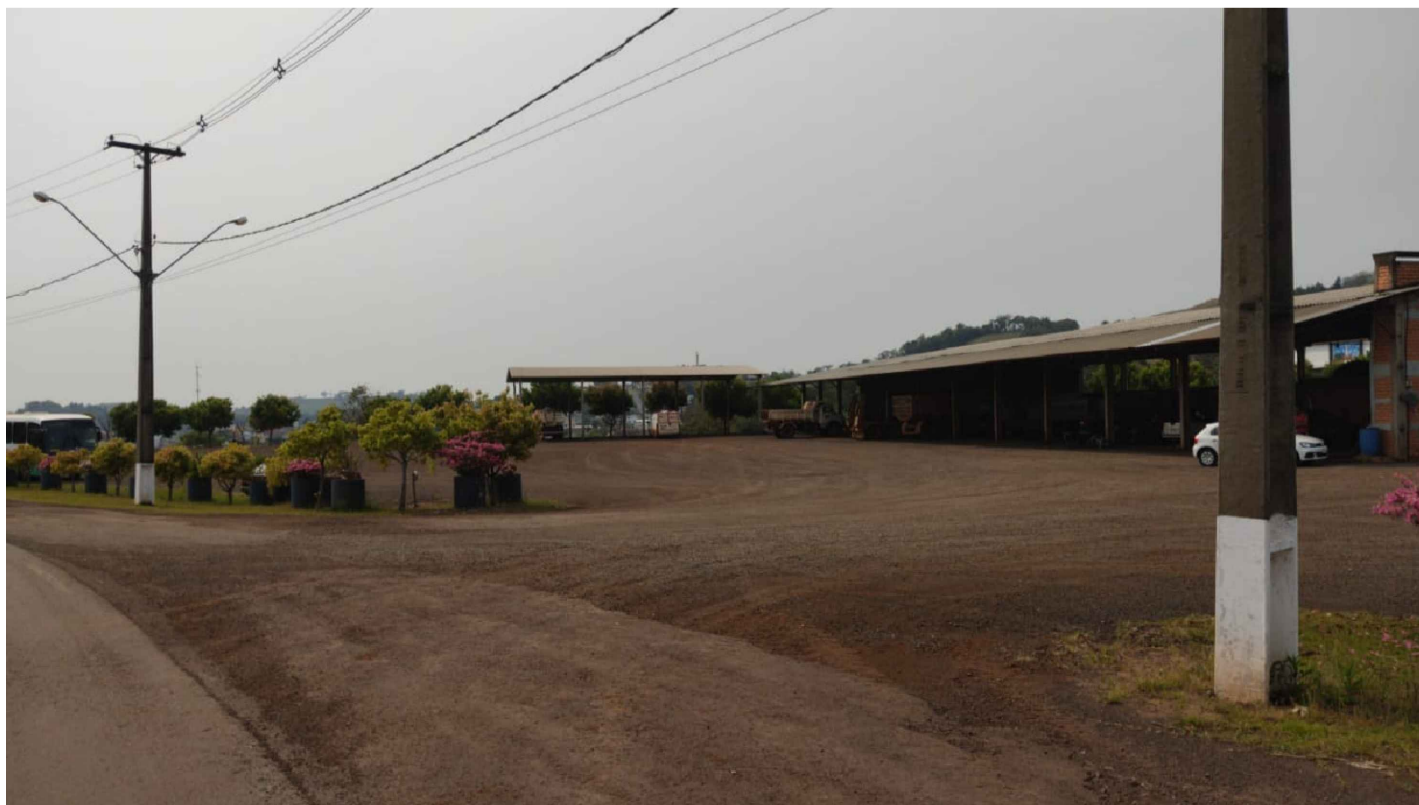
PONTO 16 - ESTRADA MUNICIPAL DOM AGOSTINHO - PARQUE DE MÁQUINAS