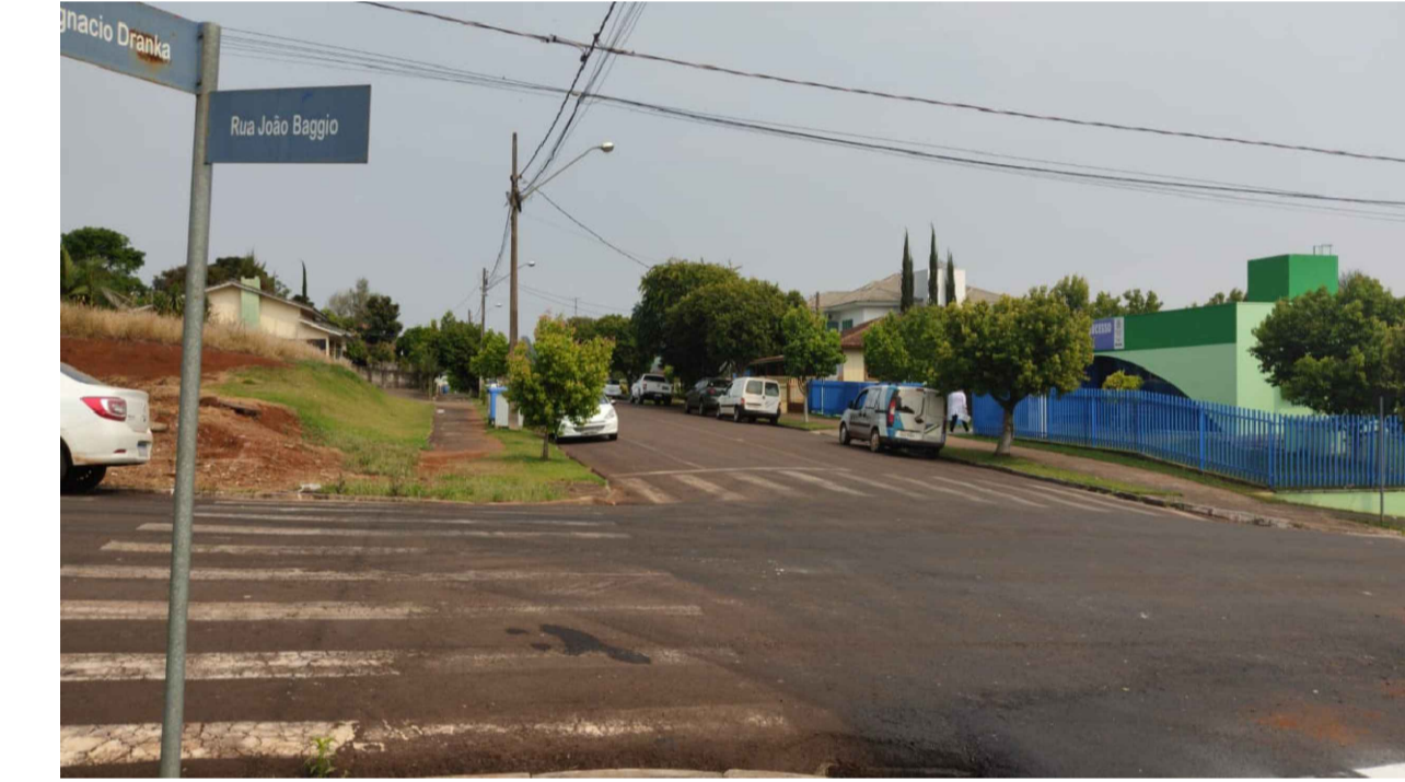
PONTO 11 - RUA IGNÁCIO DRANKA - CEMITÉRIO