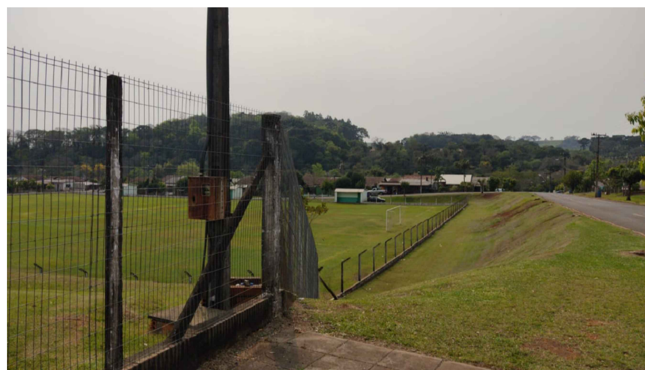
PONTO 13 - RUA JOÃO COLETTI - GINÁSIO DE ESPORTES