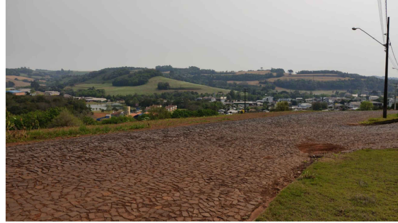
PONTO 3 - RUA ROMANO GEMI - ACESSO À COMUNIDADE TRINTA VOLTAS