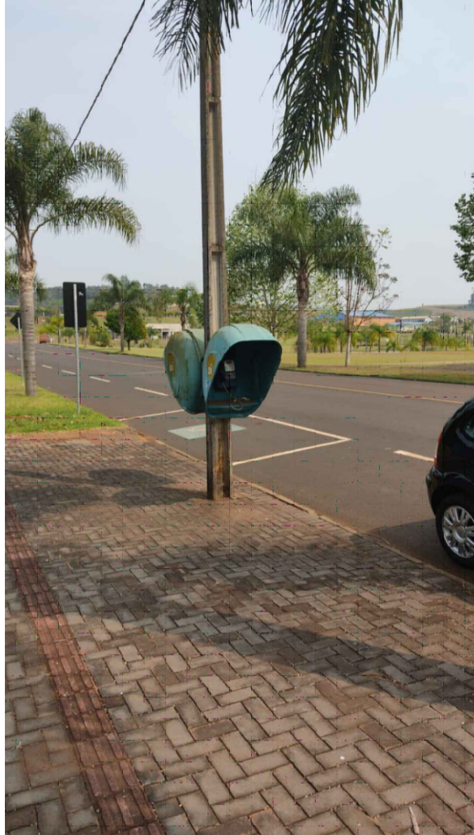
PONTO 18 - RUA PRESÍDIO BORBA - CMEI