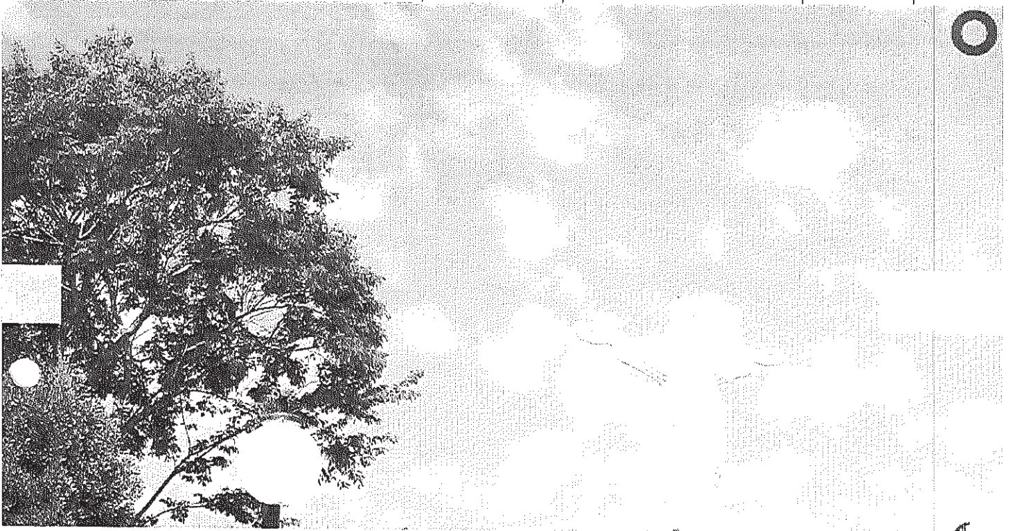
Vista panorâmica do Cristo

Início Publicações Licitações AVISO DE LICITAÇÃO - Pregão Presencial 003/2014