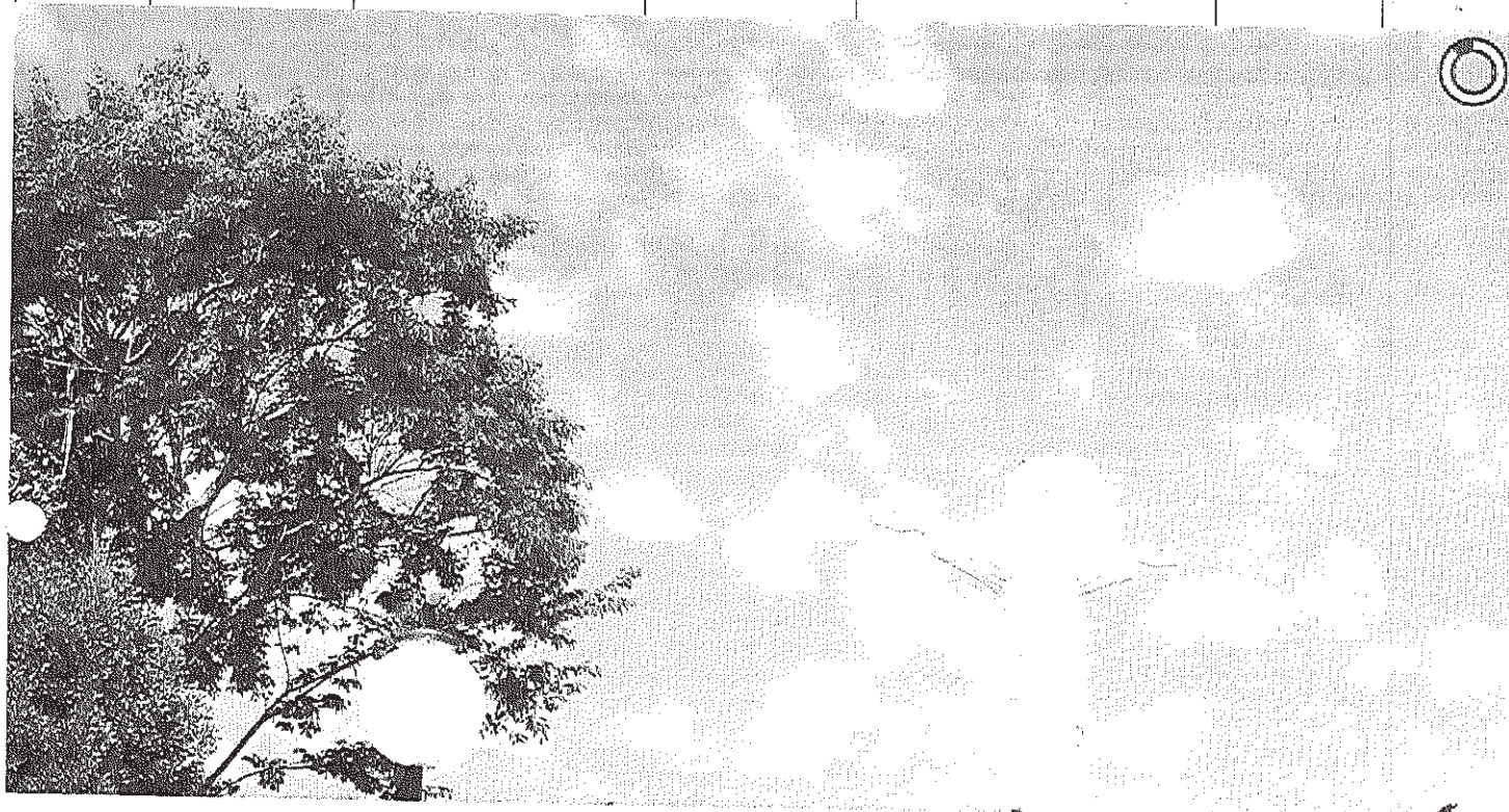
Vista panorâmica do Cristo

Início Publicações Licitações AVISO DE LICITAÇÃO - Pregão Presencial 005/2014