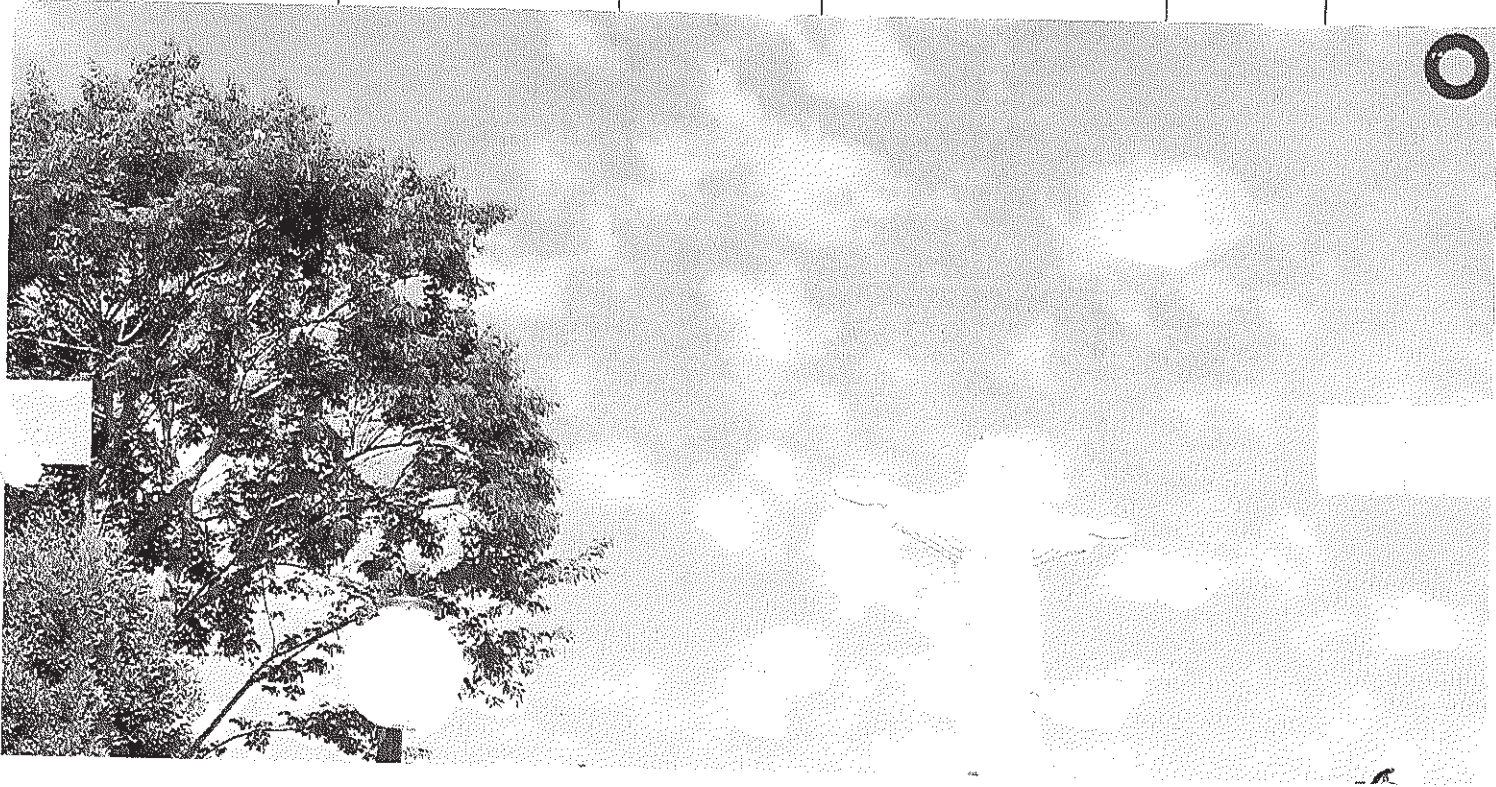
Vista panorâmica do Cristo

Início Publicações Licitações AVISO E EDITAL DE LICITAÇÃO - Pregão Presencial 025/2014