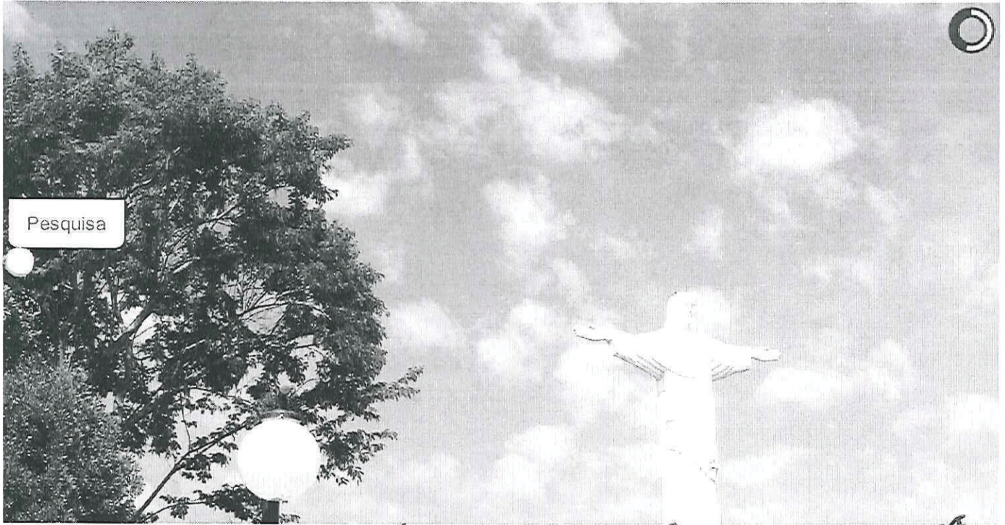
Vista panorâmica do Cristo