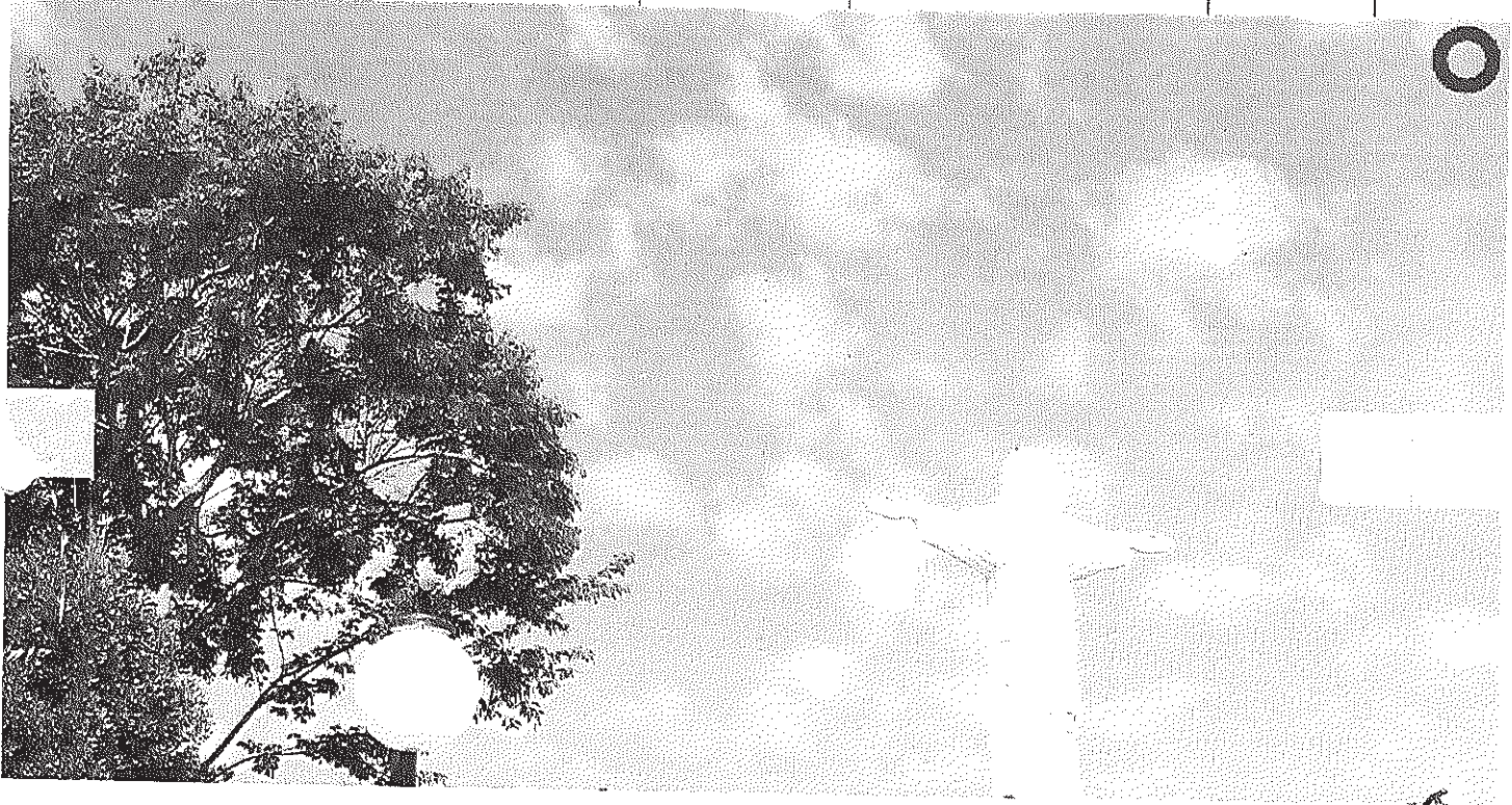
Vista panorâmica do Cristo

Início Publicações Licitações AVISO E EDITAL DE LICITAÇÃO - Pregão Presencial 013/2014