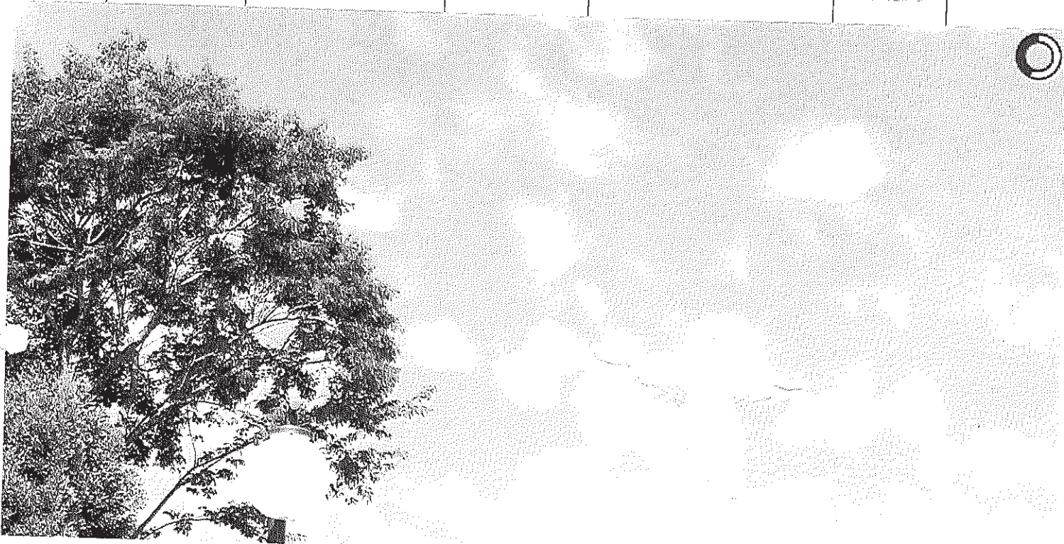
Visão panorâmica do Cristo

Início Publicações Licitações AVISO E EDITAL - Pregão Presencial 022/2014