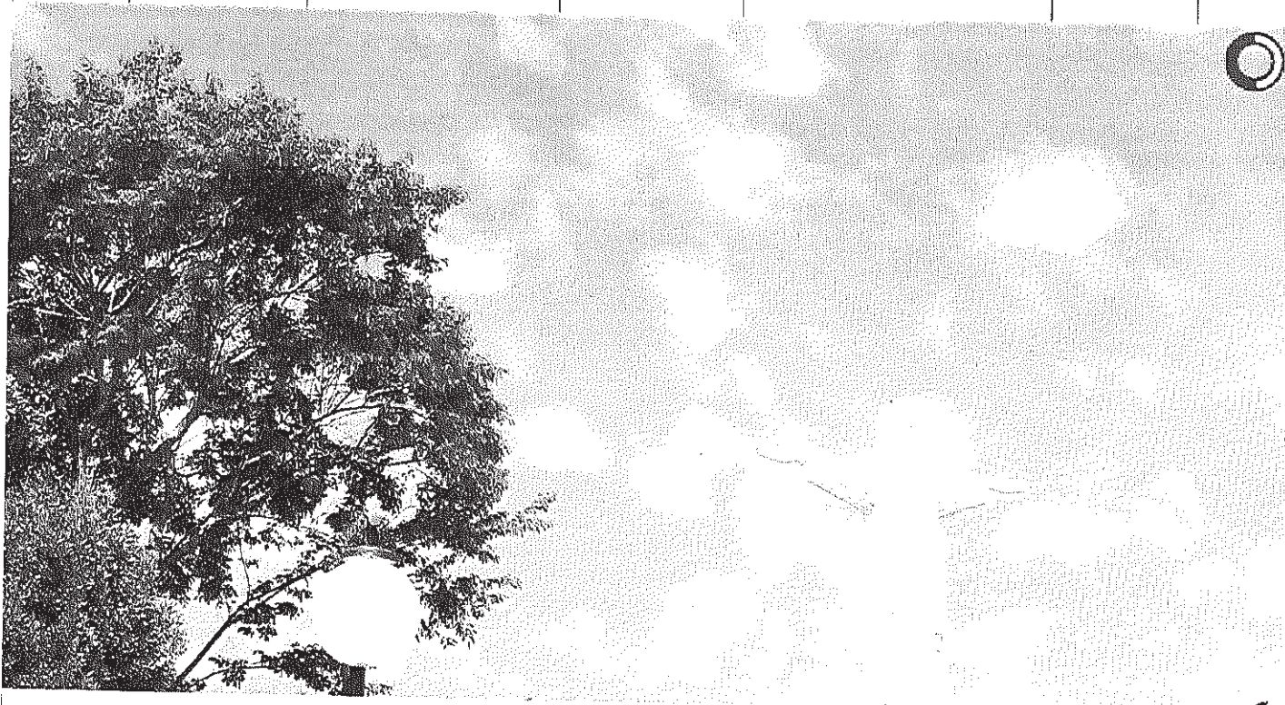
Vista panorâmica do Cristo

Início Publicações Licitações AVISO E EDITAL DE LICITAÇÃO - Pregão Presencial 031/2014