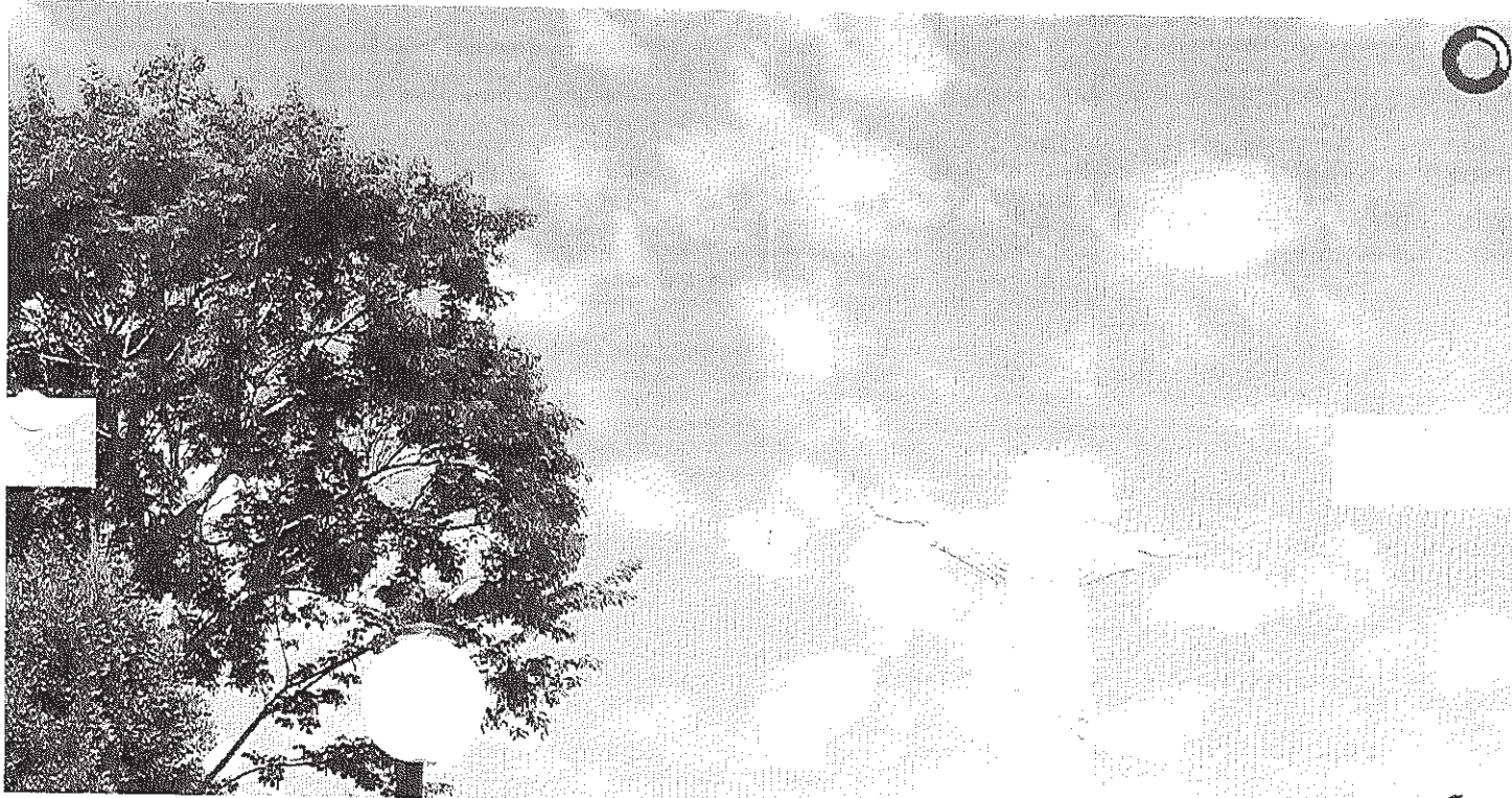
Visão panorâmica do Cristo

Início Publicações Licitações AVISO E EDITAL DE LICITAÇÃO - Pregão Presencial 032/2014