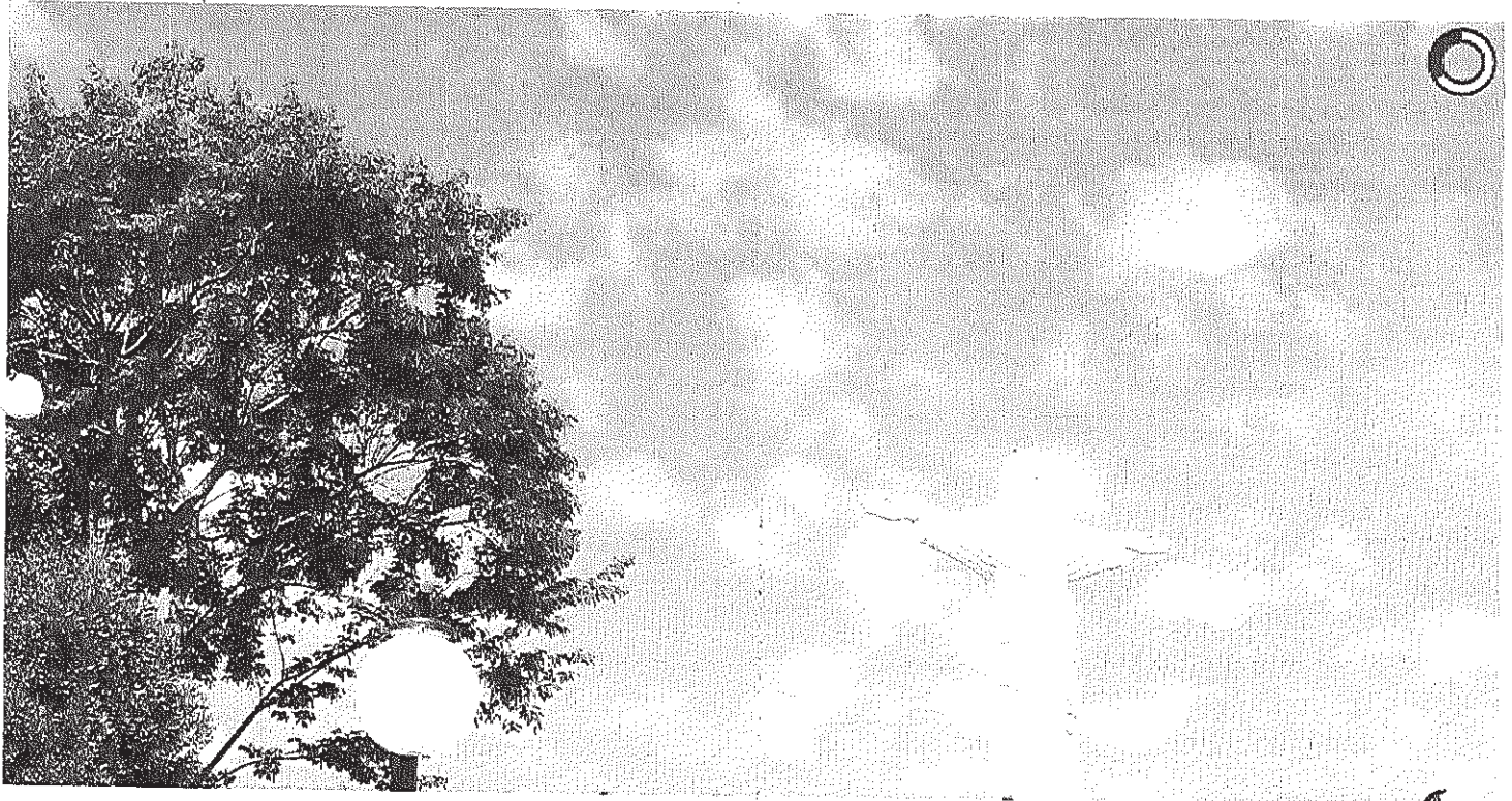
Vista panorâmica do Cristo

Início Publicações Licitações AVISO E EDITAL DE LICITAÇÃO - Pregão Presencial 035/2014