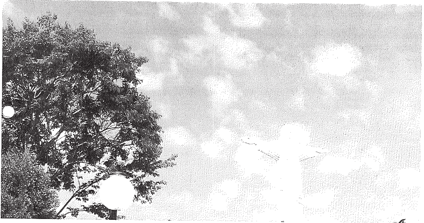
Vista panorâmica do Cristo

Início Licitações AVISO E EDITAL DE LICITAÇÃO - Pregão Presencial 039/2014