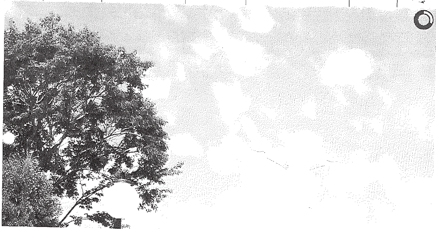
View from the town of Bom Sucesso

Início Publicações Licitações HOMOLOGAÇÃO E ADJUDICAÇÃO - Pregão Eletrônico 014/2014