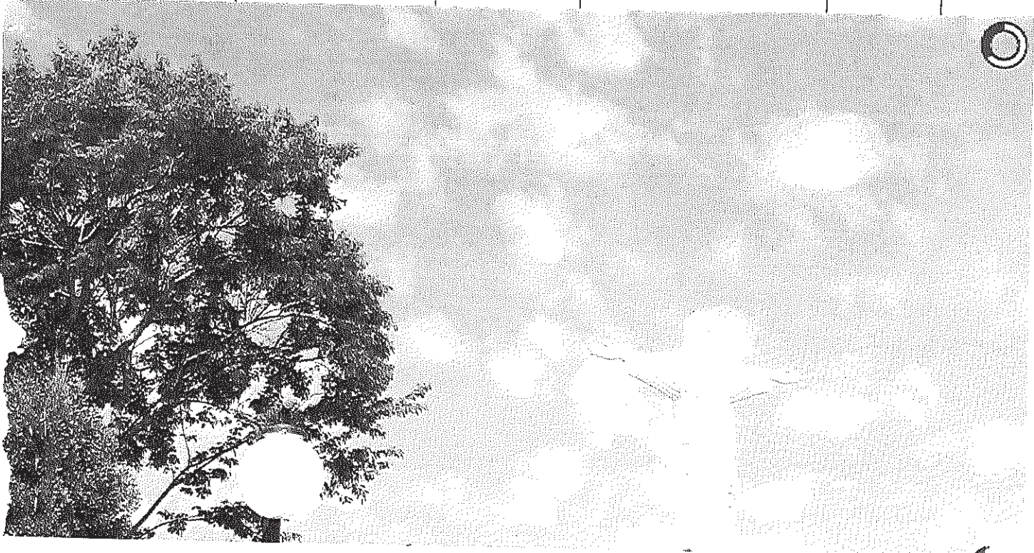
Vista panorâmica do Cristo

io Publicações Licitações HOMOLOGAÇÃO E ADJUDICAÇÃO - Pregão Eletrônico 012/2014