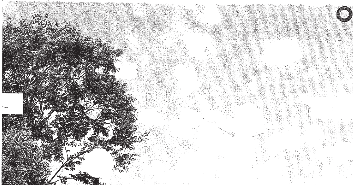
Visão para cima do Cristo

Início Publicações Licitações HOMOLOGAÇÃO E ADJUDICAÇÃO - Pregão Eletrônico 028/2014