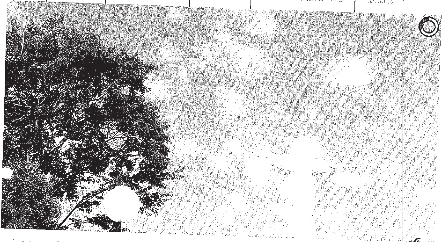
Vista panorâmica do Cristo

Início Publicações Licitações ADJUDICAÇÃO/HOMOLOGAÇÃO - Pregão Presencial 001/2014