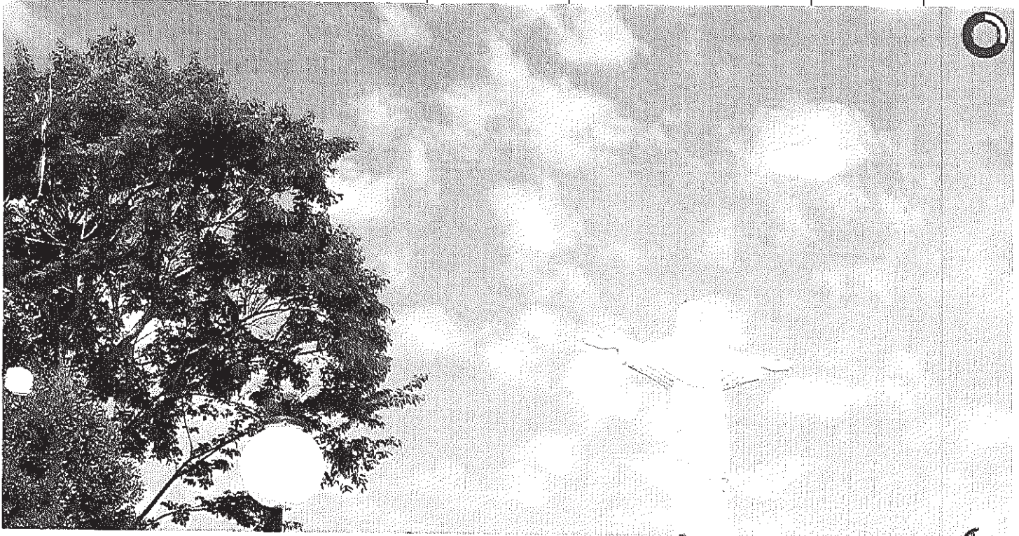
Vista panorâmica do Cristo

Início Publicações Licitações ADJUDICAÇÃO/HOMOLOGAÇÃO - Pregão Presencial 002/2014