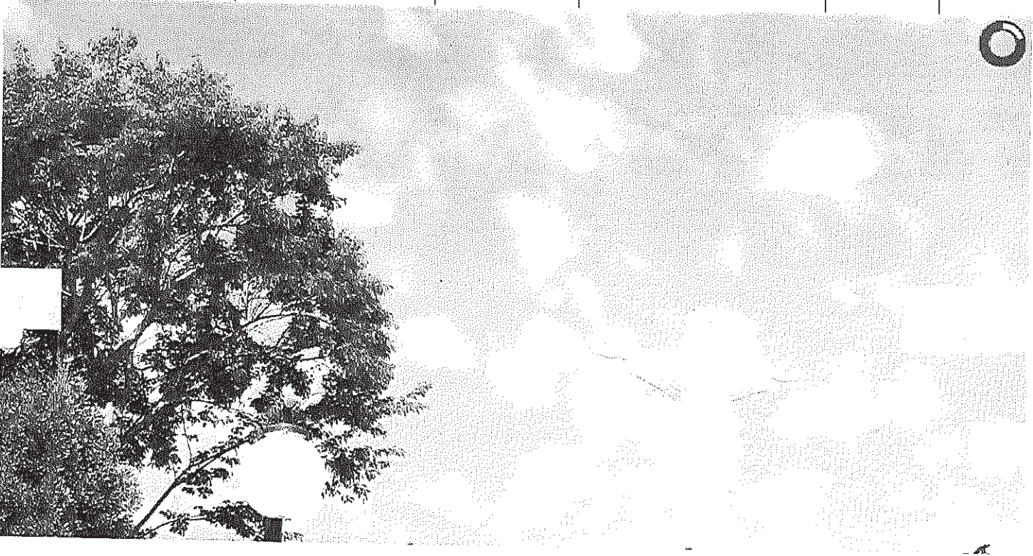
Vista panorâmica do Cristo

Início Publicações Licitações HOMOLOGAÇÃO E ADJUDICAÇÃO - Pregão Eletrônico 009/2014