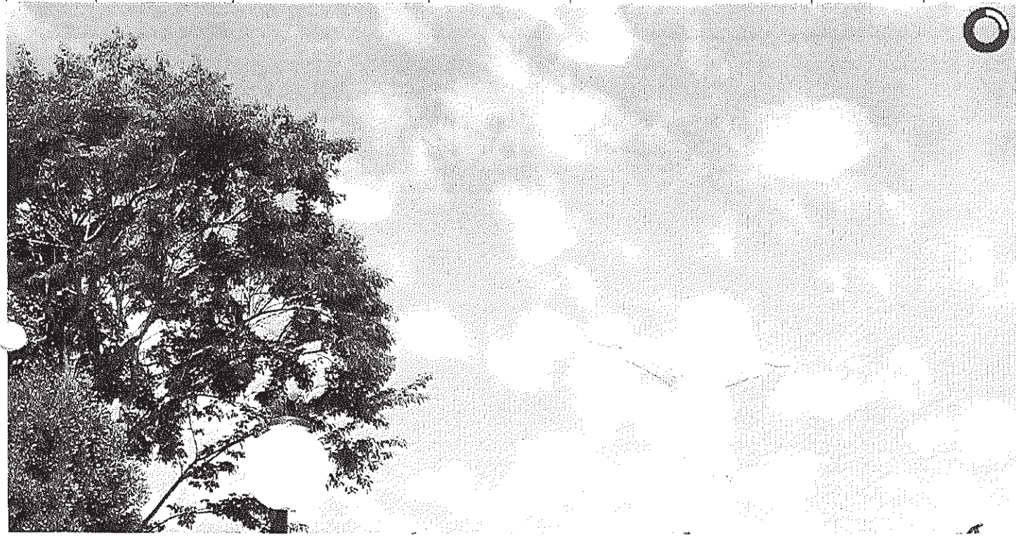
Vista panorâmica do Cristo

Início Publicações Licitações HOMOLOGAÇÃO E ADJUDICAÇÃO - Pregão Presencial 020/2014