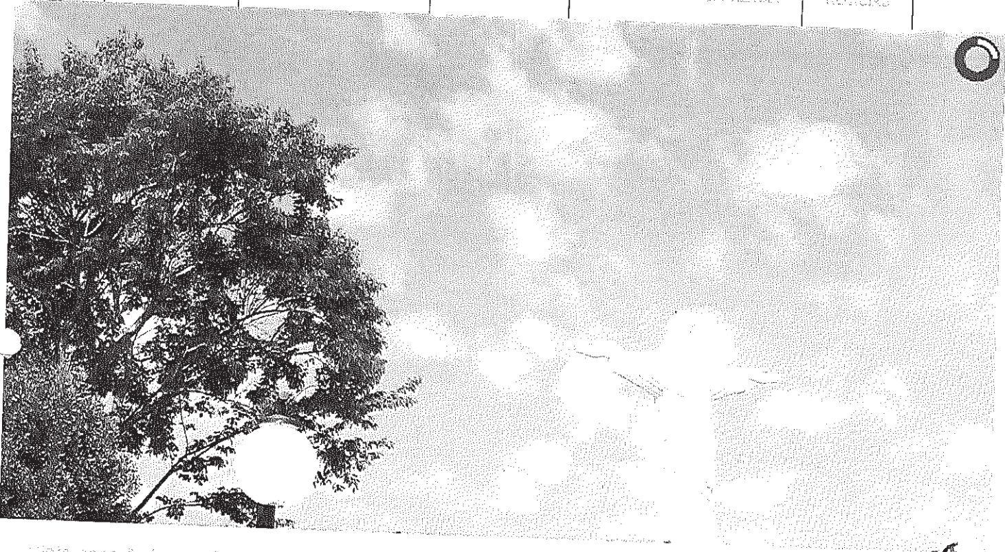
Vista panorâmica do Cristo

Início Publicações Licitações HOMOLOGAÇÃO E ADJUDICAÇÃO - Pregão Presencial 025/2014