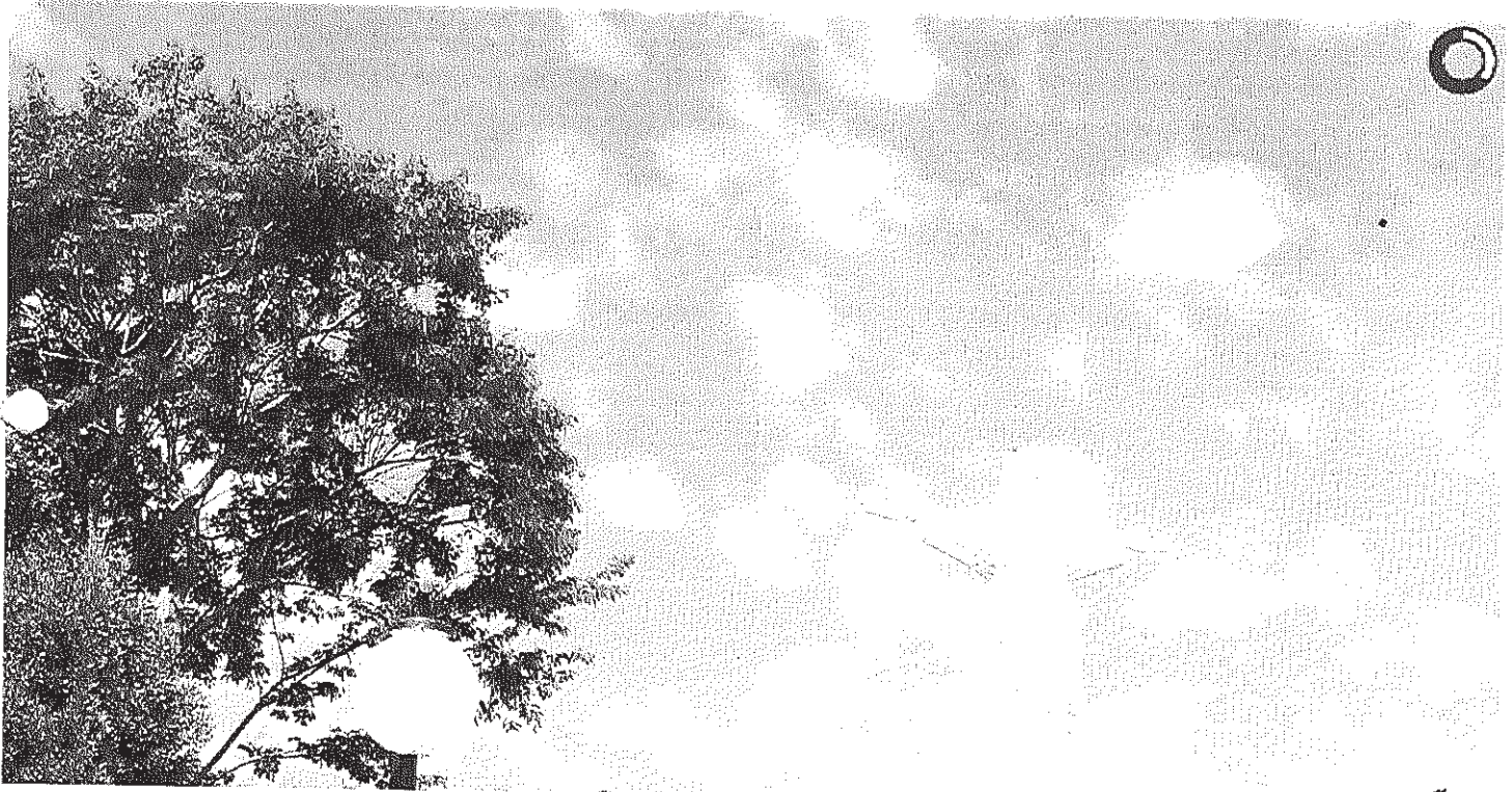
Foto panorâmica do Cristo

Início Publicações Licitações HOMOLOGAÇÃO E ADJUDICAÇÃO - Pregão Eletrônico 029/2014