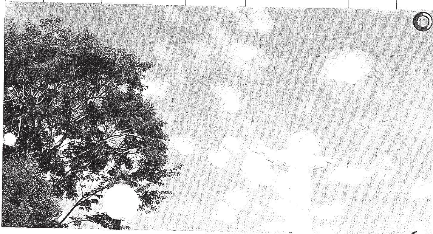
Visão panorâmica do Cristo

Início Publicações Licitações HOMOLOGAÇÃO E ADJUDICAÇÃO - Pregão Presencial 003/2014