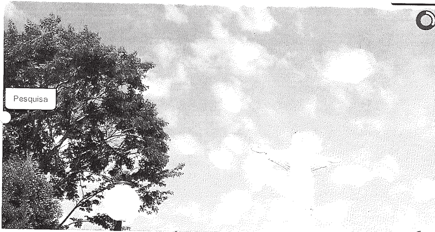
Vista panorâmica do Cristo

Início Publicações Licitações HOMOLOGAÇÃO - Pregão Presencial 050/2013