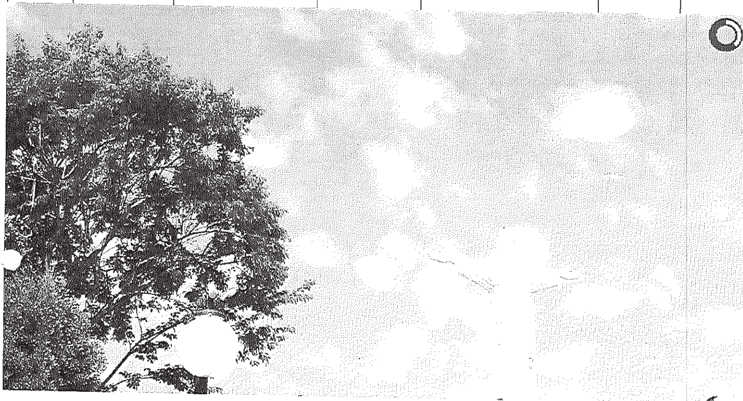
Vista panorâmica do Cristo

Início Publicações Licitações HOMOLOGAÇÃO E ADJUDICAÇÃO - Pregão Presencial 006/2014