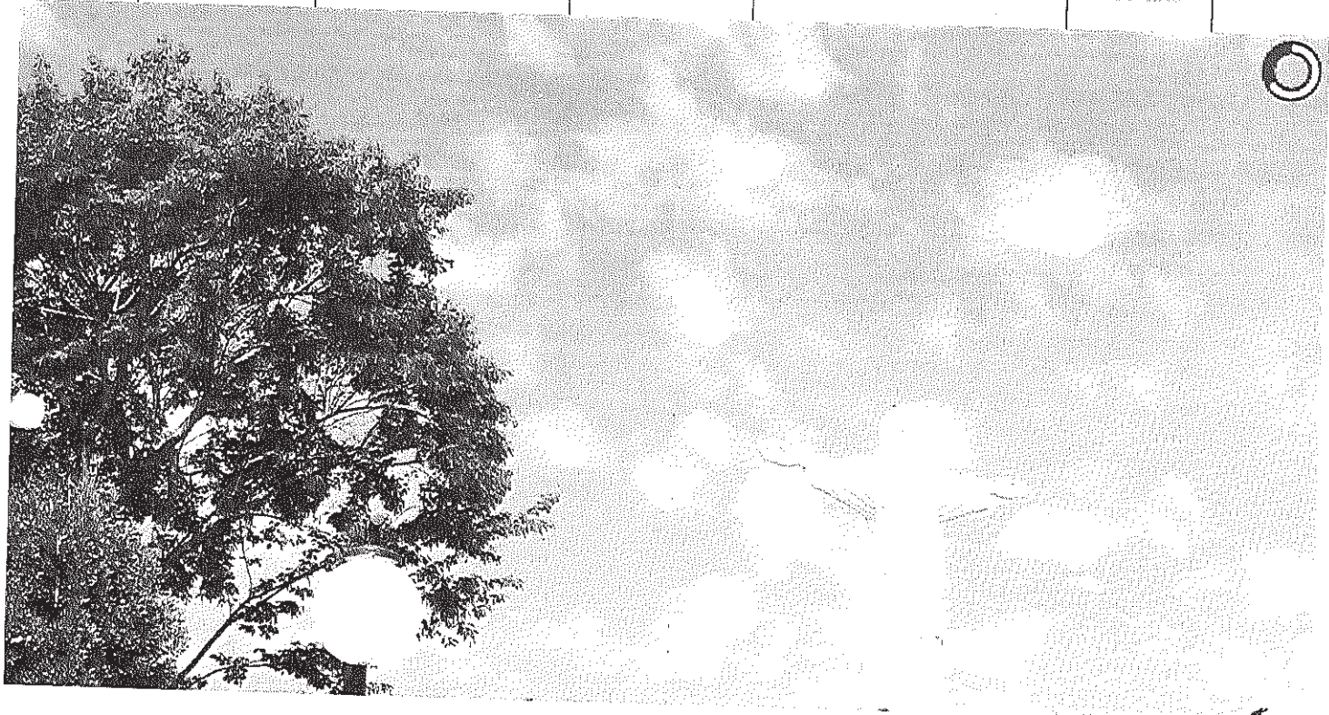
Vista panorâmica do Cristo

Início Publicações Licitações HOMOLOGAÇÃO E ADJUDICAÇÃO - Pregão Presencial 013/2014