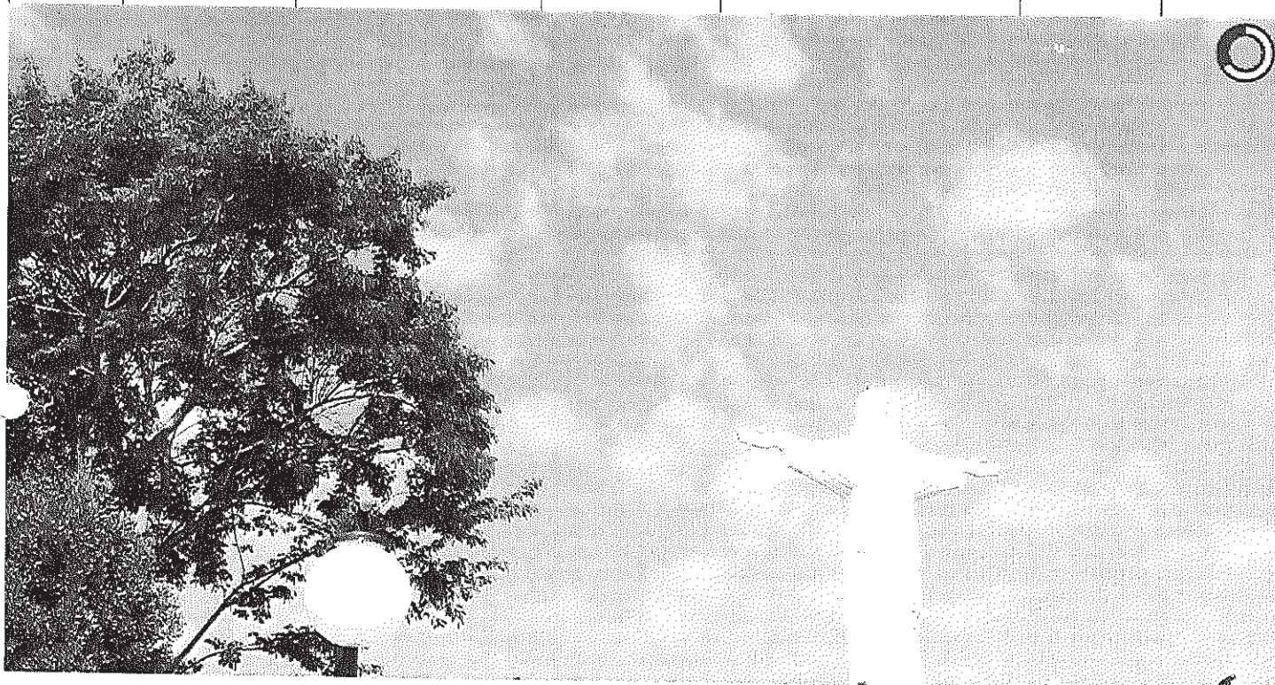
Vista panorâmica do Cristo

Início Publicações Licitações HOMOLOGAÇÃO E ADJUDICAÇÃO - Pregão Presencial 023/2014