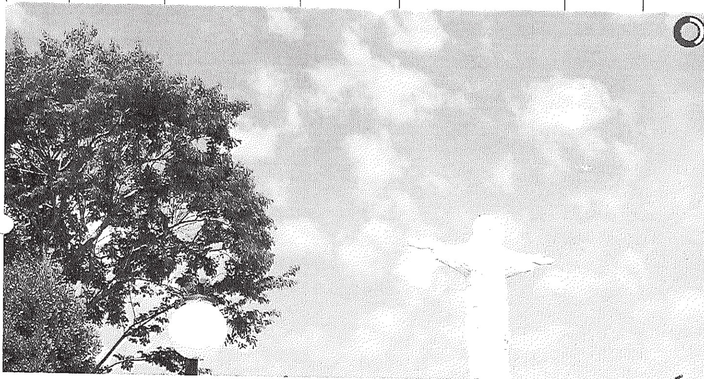
Vista panorâmica do Cristo

Início Publicações Licitações HOMOLOGAÇÃO E ADJUDICAÇÃO - Pregão Presencial 023/2014