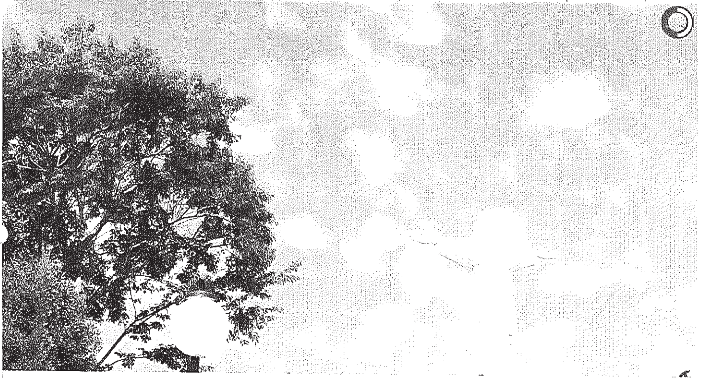
Área verde é vida do Cristo

Início Publicações Licitações HOMOLOGAÇÃO E ADJUDICAÇÃO - Pregão Presencial 026/2014