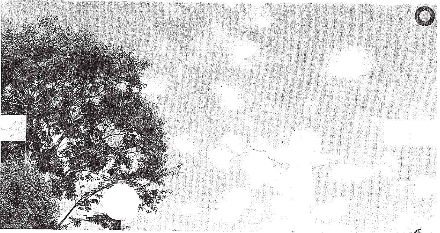
Vista panorâmica do Distrito

Início Publicações Licitações HOMOLOGAÇÃO E ADJUDICAÇÃO - Pregão Presencial 032/2014