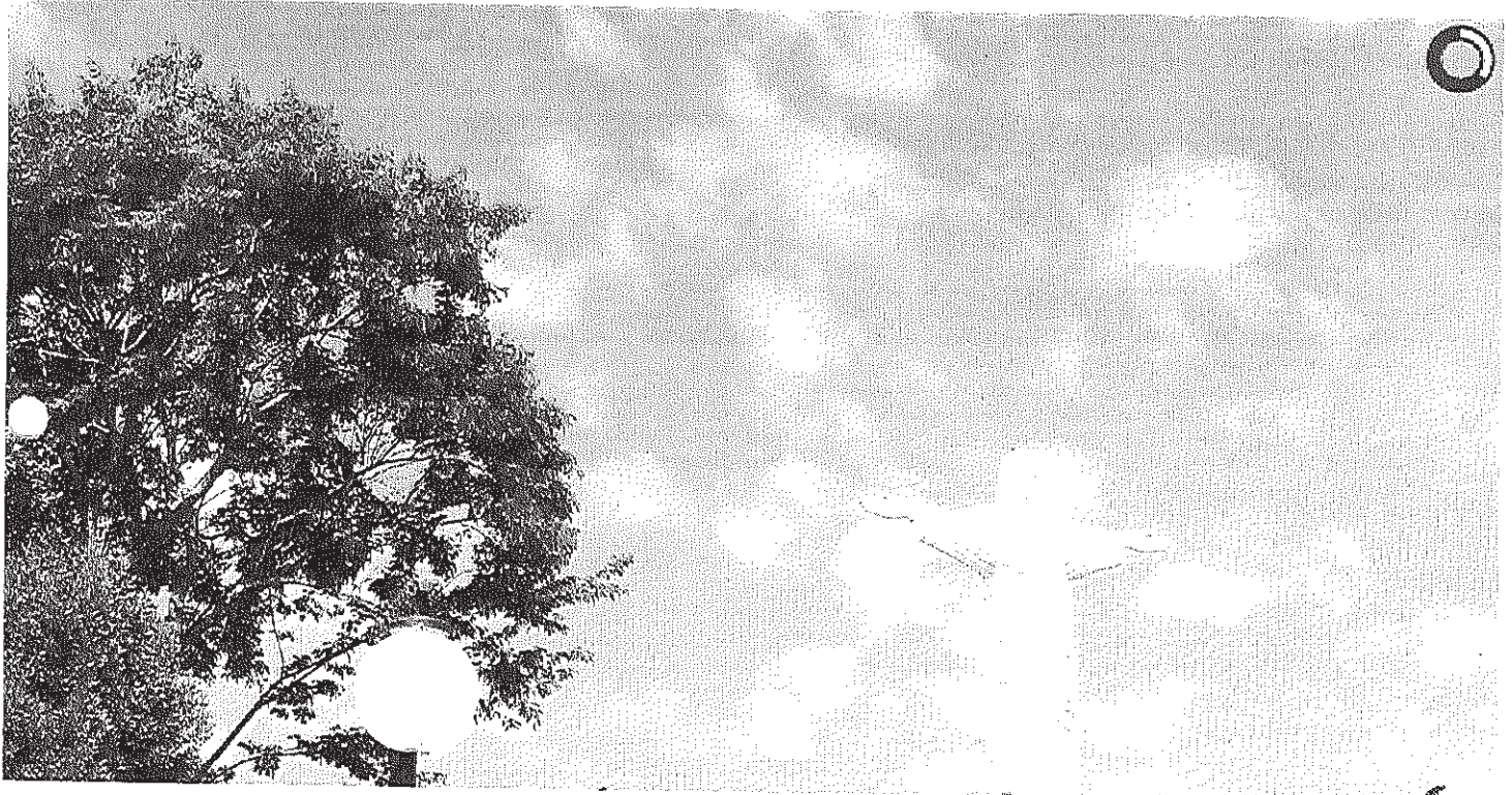
Visão panorâmica do Cristo

Início Publicações Licitações HOMOLOGAÇÃO E ADJUDICAÇÃO - Pregão Presencial 033/2014