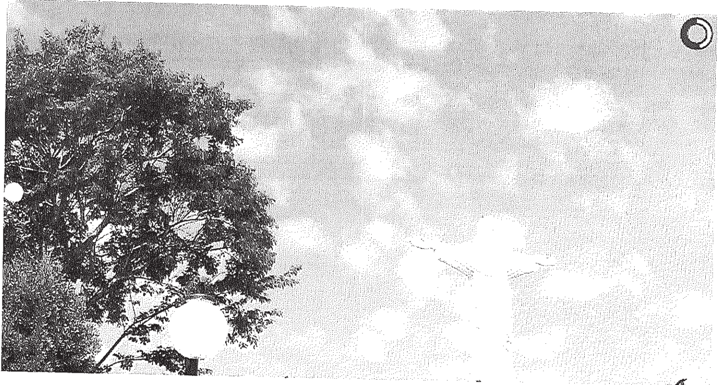
Vista panorâmica do Cristo

Início Licitações HOMOLOGAÇÃO E ADJUDICAÇÃO - Pregão Presencial 035/2014