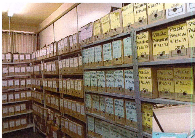
Sala de Arquivos Finalizados