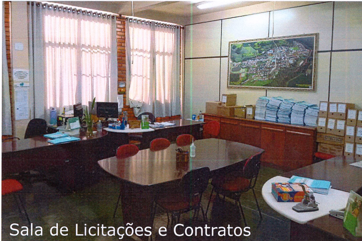
Sala de Licitações e Contratos