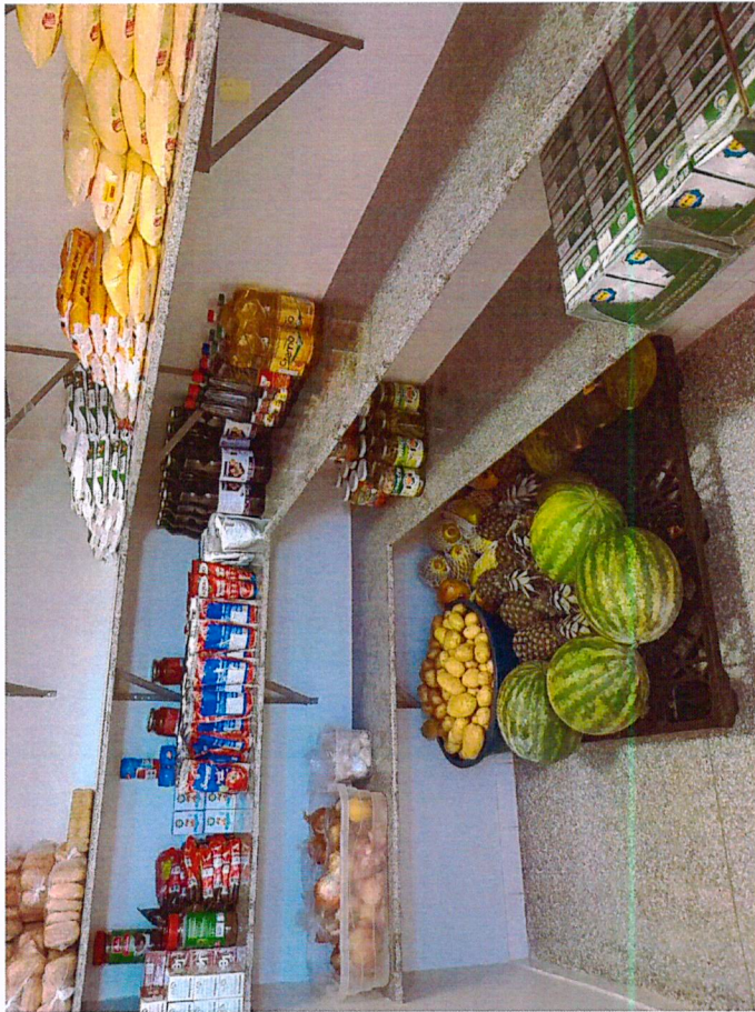
Depósito da cozinha do Cmei Vovó

Pode ser observado na visita "in loco", que em ambas as Escolas todos os produtos e alimentos estão devidamente separado, organizado por data de validade e local limpo e fresco.