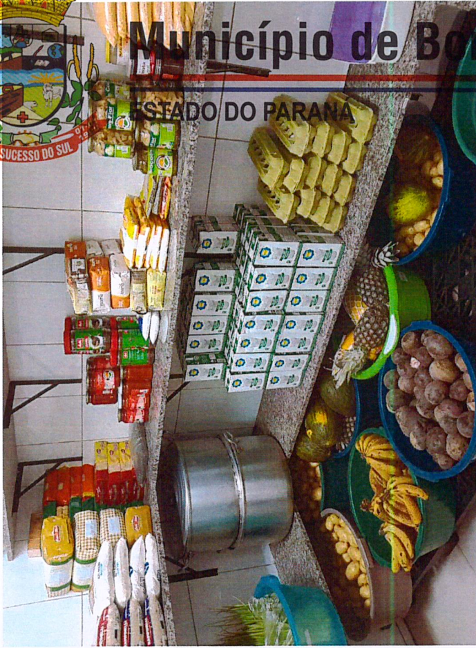
Depósito da cozinha da Escola Irma N. E. U.