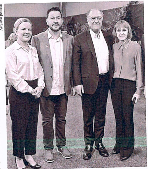
No Encontro de Municípios Paranaenses, promovido pela AM (Associação dos Municípios do Paraná), ontem em Curitiba, as presenças da presidente nacional do PT, deputada federal Gleisi Hoffmann, presidente estadual do PT, deputado Arilson Chiorro, vice-presidente Geraldo Aickmin e a deputada estadual Luciana Rafagnin

O ministro sinalizou positivamente para a possibilidade de implantação do aeroporto e pediu para que a Prefeitura de Dois Vizinhos formalize a solicitação para dar início aos trabalhos de análise para construção da unidade.