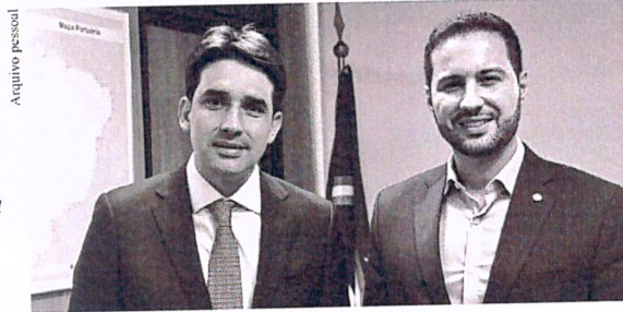
Ministro de Portos e Aeroportos, Silvio Costa Filho, e o deputado federal presidente da Comissão do Turismo, Paulo Litro: conversa em Brasília.

Parlamentar apresentou solicitação de implantação de aeroporto em Dois Vizinhos, que é uma referência no Sudoeste e conta com unidade da UTFPR, Unisep e grandes empresas.